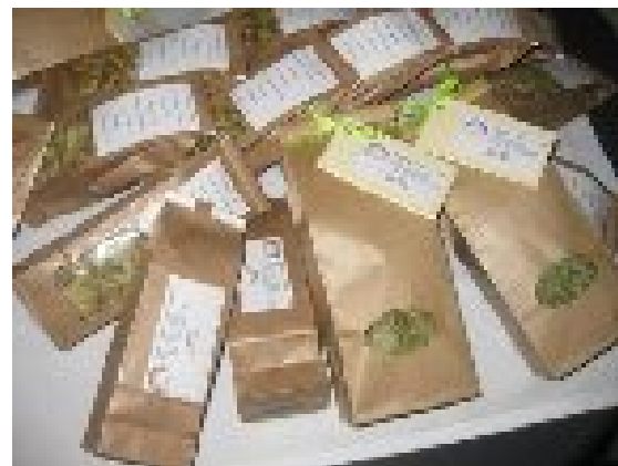
ZELIŠČA IN ČAJI