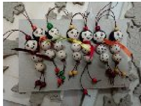
OBESKI - RAZLIČNI