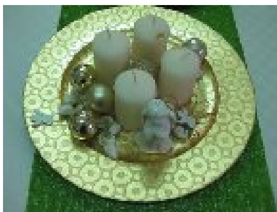
RAZNI NOVOLETNI ARANŽMAJI IN ADVENTNI VENČKI