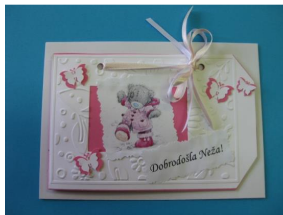
VOŠČILNICE IN ČESTITKE ZA RAZLIČNE PRILOŽNOSTI