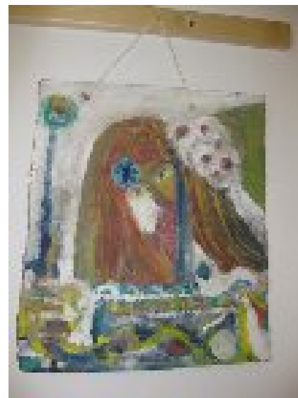
SLIKE NA PLATNU