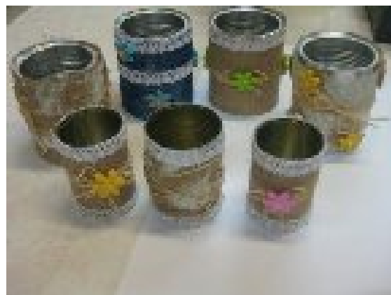
LONČKI ZA PISALA