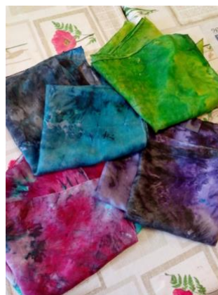
SVILENE RUTICE IN ŠAL