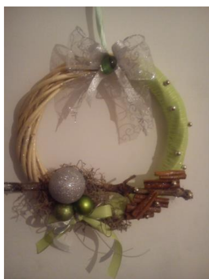
VENČKI ZA VRATA