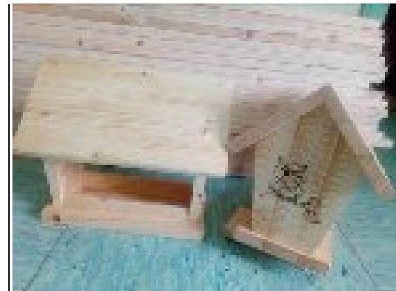
IZDELKI IZ LESA