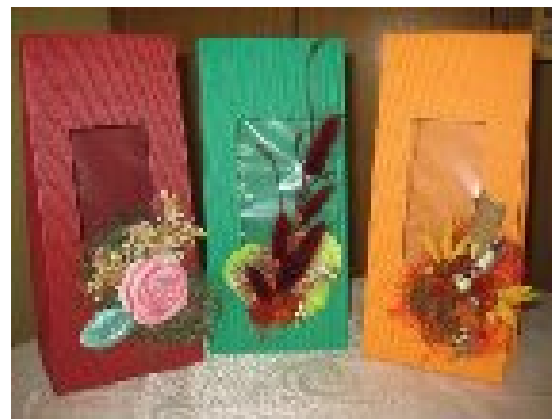
DARILNE ŠKATLE IN VREČKE