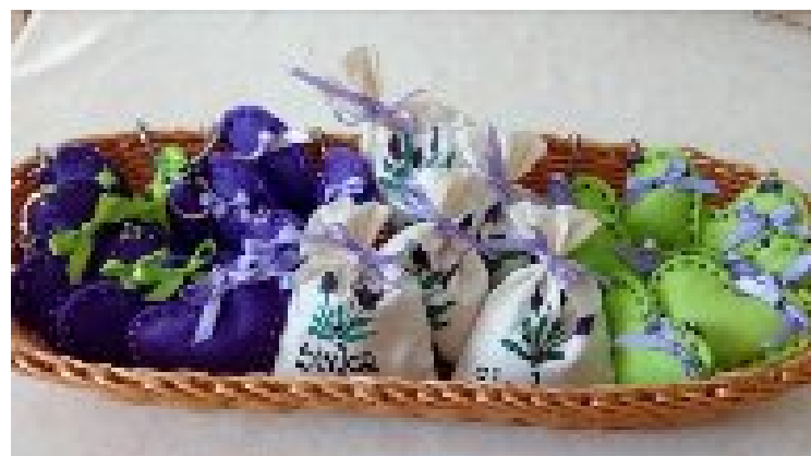
IZDELKI IZ SIVKE