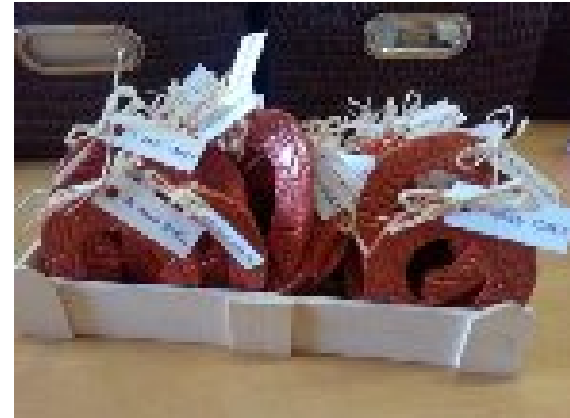
IZDELKI IZ GLINE